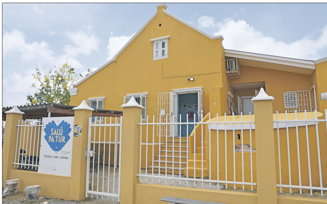
Het onderkomen van de stichting.