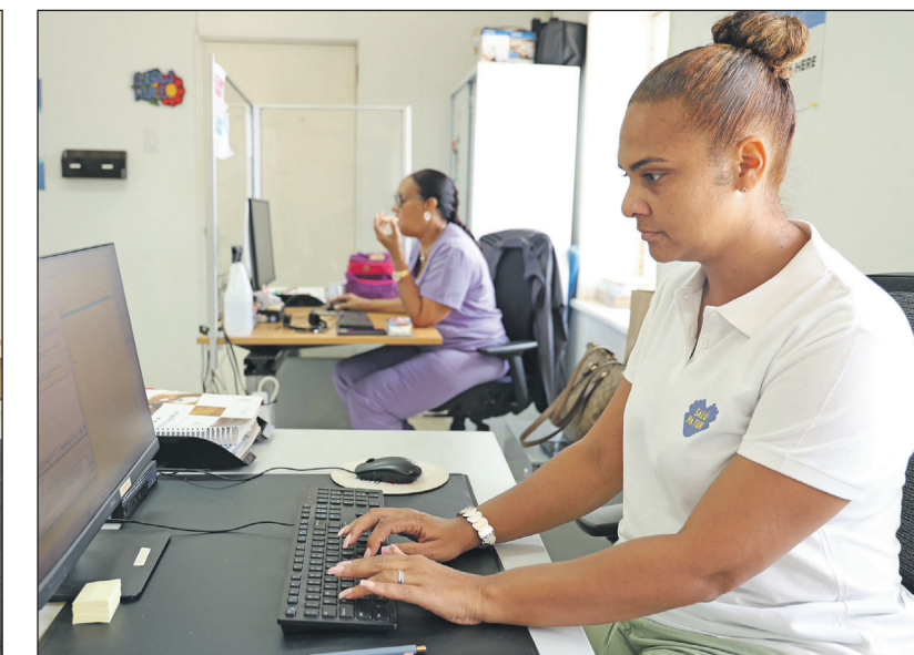
Op kantoor wordt alles goed bijgehouden.