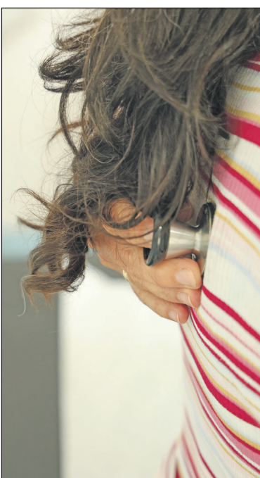
Patiënten kunnen bij de huisarts terecht voor allerlei klachten.